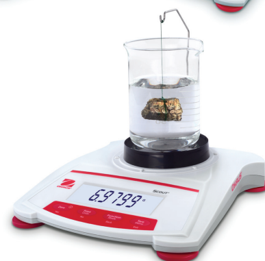
Volitelná sada pro stanovení hustoty