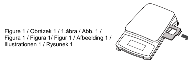
Figure 1 / Obrázek 1 / 1. ábra / Abb. 1 / Figura 1 / Figura 1 / Figur 1 / Afbeelding 1 / Illustrationen 1 / Rysunek 1